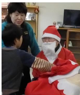
サンタさんからクリスマスプレゼント

12月22日(金)午後3時からモンペリ広場でクリスマス会を開催しました。その日は小学校の終業式、こども達は給食を食べ、通知表をもらい、いよいよ翌日から冬休みです。休み前に今までの感謝と今後の期待を込めてNPO法人こ・こ・ろが企画したもので