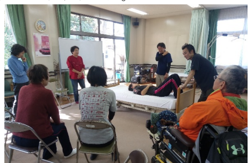
ベッド上での介助

次会の楽ちん介護は平成30年1月21日（日）9時から、新取手駅近くの障害福祉センター「あけぼの」で開催します。この機会に、腰に負担のない介護技術を覚えてください。 (宮脇 貞夫 記)